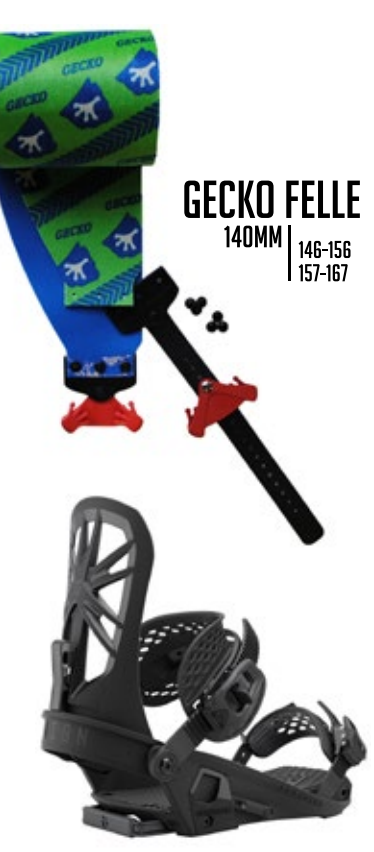
UNION BINDUNG EXPLORER 2022 SIMIL